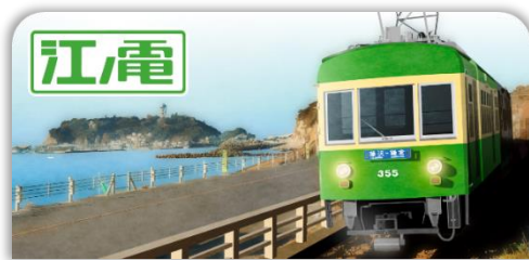
江ノ島電鉄スタンプ帳ラベル