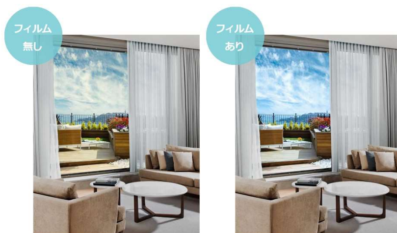
ポジカ®くつきり™フィルムによる視覚効果（イメージ写真）

https://www.tanseisha.co.jp/solution/closeup/posica