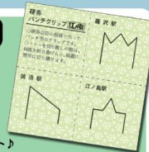
▲硬券パンチクリップ (数量限定)